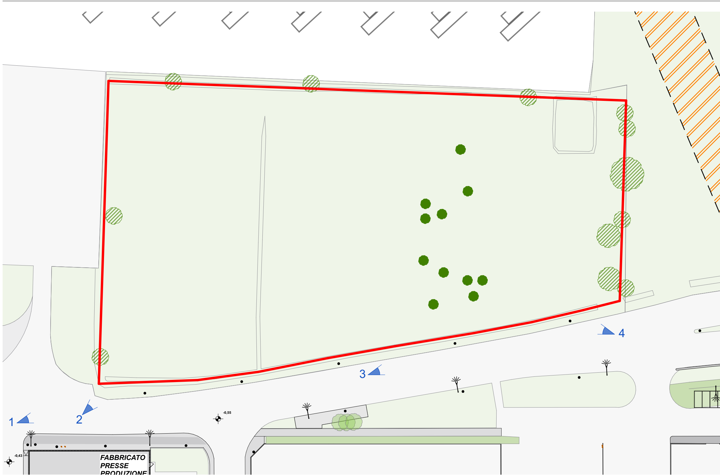
RILIEVO FOTOGRAFICO - PUNTI DI VISTA